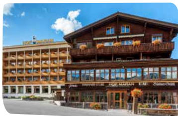
Golf- & Sporthotel Hof Maran****