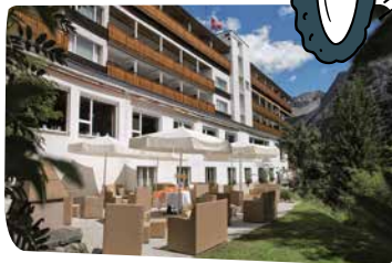
Sunstar Hotel Arosa****